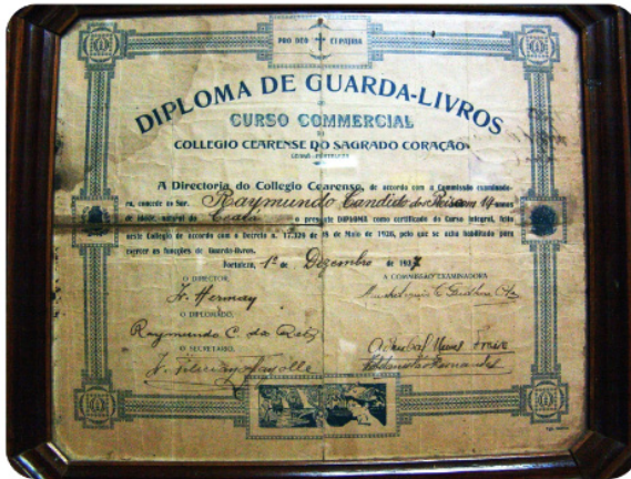
DIPLOMA DE GUARDA LIVROS (CONTADOR)

Obteve Diploma de Guarda-Livros no Colégio Cearense do Sagrado Coração (1927); e Diploma de Datilógrafo pela Escola Royal (1928);