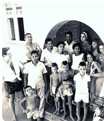
COM OS IRMÃOS EM FORTALEZA-CE