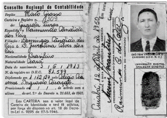
CARTEIRA DO CRC