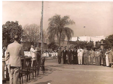
ATO CÍVICO COMO PRESIDENTE DA CÂMARA