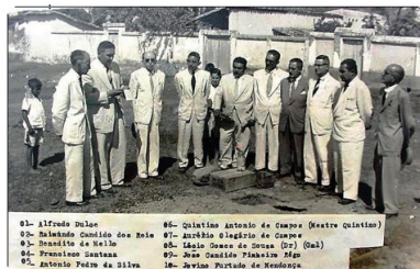
LANÇAMENTO DA PEDRA FUNDAMENTAL (SEDE DA MAÇONARIA)

Foi cofundador e Sócio Representativo do Rotary Club de Cáceres, tendo também exercido sua Presidência; Hoje