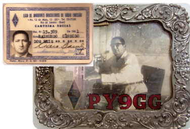
O RADIO AMADOR - “SENTINELA DE CÁCERES”

Como membro da Loja Maçônica União e Força, ocupou várias funções, participando do lançamento da pedra fundamental das suas atuais instalações; Venerável Mestre da Augusta e Respeitável Loja Simbólica União e Força; Fundador da “Escola União e Força”; homenageado com seu nome dado à 1ª Escola de Contabilidade de Cáceres: Escola Técnica de Comércio Raimundo Cândido dos Reis.