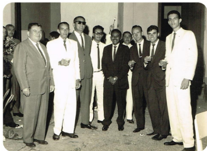
COM O PREFEITO, VEREADORES E AMIGOS