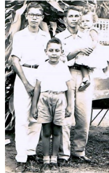
OS 4 FILHOS

Sua descendência (2020): 4 (quatro) filhos; 12 (doze) netos(as); 11 (onze) bisnetos(as) e 2 (dois) tataranetos.