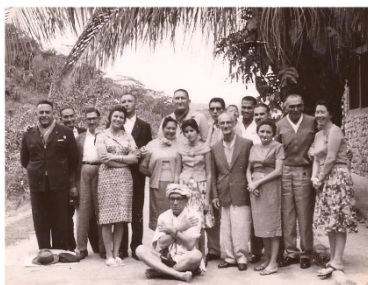
ENCONTRO ROTARIANO (Águas Quentes)