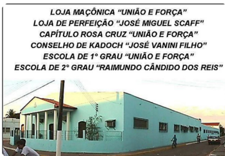
PRÉDIO DA LOJA MAÇÔNICA "UNIÃO E FORÇA"