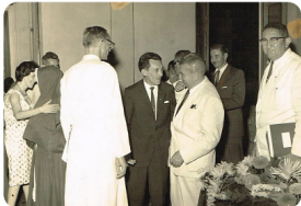
SANÇÃO DA LEI DE REFORMA TRIBUTÁRIA e ADMINISTRATIVA-1963