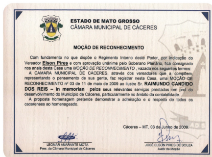
MOÇÃO DA CAMARA in memoriam