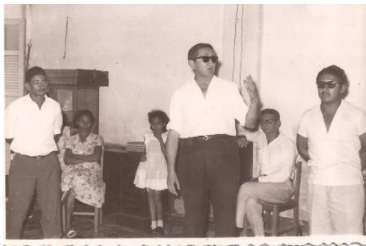
1º de Maio na União Operária Cacerense