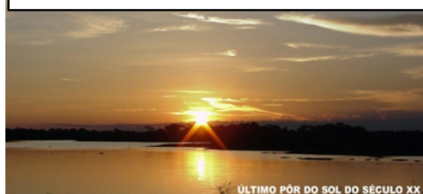
ÚLTIMO PÔR DO SOL DO SÉCULO XX